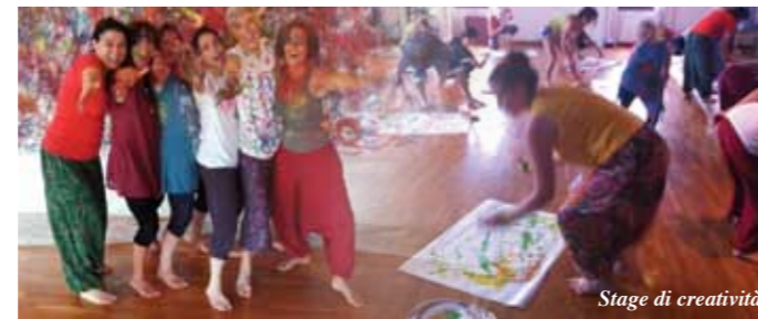
Stage di creatività